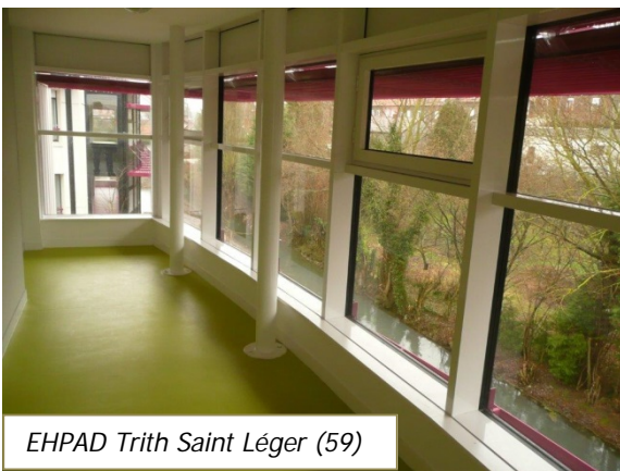
EHPAD Trith Saint Léger (59)