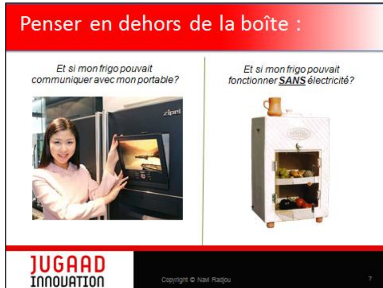
Figure 1 : exemple du frigo sans électricité

l'occident. Comme l'Inde, l'Afrique part de zéro, sans infrastructures, et va sauter des étapes entières de développement en devenant un laboratoire de l'innovation frugale. Par exemple, ces pays utilisent beaucoup le système de paiement mobile M-PESA car les habitants n'ont souvent pas de compte bancaire et se passent de l'utilité d'avoir une banque. Au titre des innovations frugales, on trouve encore des dispositifs qui permettent de recharger un téléphone portable grâce à un vélo, ou encore un frigo qui peut se passer d'électricité pour fonctionner. Le principe est toujours de faire mieux avec moins de ressources.