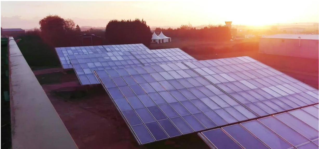
Installation Lys Services (59)

Accompagnée par le CD2E, l'entreprise belge SUNOPTIMO développe son activité d'installations solaires thermiques depuis 2011. En janvier 2019, elle a équipé l'entreprise Lys Services spécialisée dans le lavage de citernes à Merville (59), d'un Opticube : une solution qui lui permet de produire une partie de son eau chaude grâce au soleil.